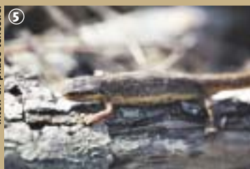
Titon en phase terrestre.

*L'Almanach du Parc Naturel des Hauts-Pays 2002 raconte cette légende du Caillou qui Bique en s'inspirant de la monographie « Au Pays des deux Honnelles » de Paul Eveve, sortie à l'enseigne de la Fédération du Tourisme de la Province du Hainaut en 1967.